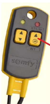
Bouton pour appuyer les deux directions en même temps

Le réglage des positions de fin de course doit être réalisé par un câble de montage équipé d'un bouton particulier qui couple les deux sens en même temps (par exemple, câble de montage Somfy). Après le branchement dans la prise, le témoin de fonctionnement jaune sur le câble Somfy doit s'allumer (s'il ne s'allume pas, il y a un défaut au niveau de la distribution de l'électricité ou du câble de montage).